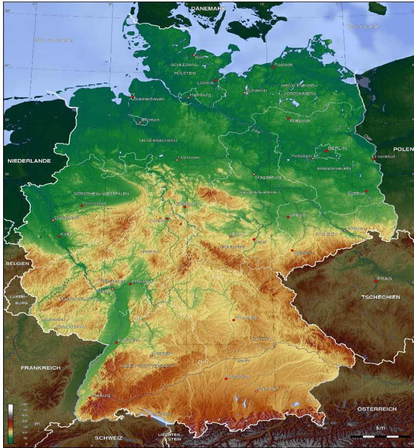
Şekil 1. Almanya’nın Fiziki Haritası

Kuzeyden Güneye hava hattı uzunluğu 876 km’dir. Batıdan Doğuya uzunluğu ise 640 km’dir. Rusya Federasyonu’ndan sonra Avrupa’nın en çok nüfusa sahip ülkesidir.